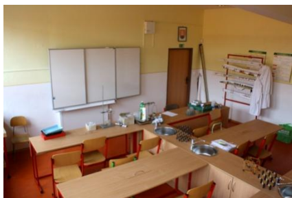
Odborná učebňa prírodovedných predmetov

V súčasnom období sme svedkami plnenia sa veľkého sna všetkých obyvateľov Bobrova – začala sa výstavba telocvične. Jej hrubá stavba už stojí.