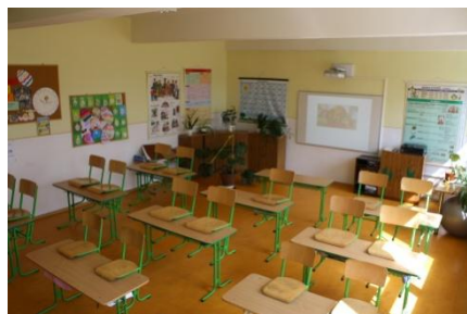
3.A s interaktívnym dataprojektorom