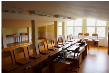
Jazyková učebňa zariadená v rámci rekonštrukcie (2010)