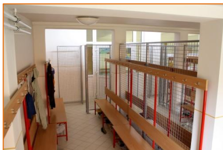
Šatne – vďaka ním je hlavná chodba vždy čistá a veci tak neprekážajú počas hodín telocviku