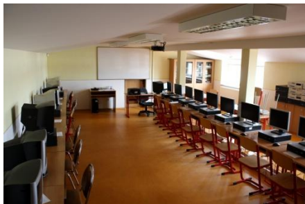
Počítačová učebňa zariadená počítačmi z projektu Infovek (2003) a Modernizácia vzdelávania na ZŠ (2010)