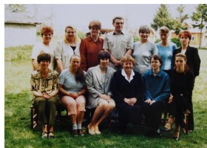
Učiteľský kolektív 2002/2003