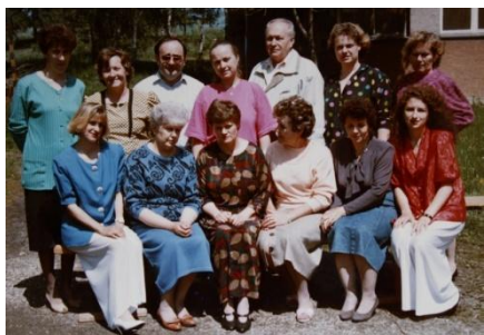
Učiteľský kolektív 1993/94