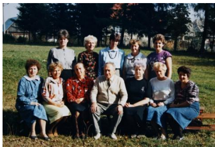
Učiteľský kolektív 1990/1991