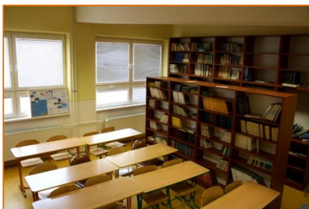
Knižnica sa postupne dopĺňa novými titulmi, žiaci tu mávajú hodiny literatúry